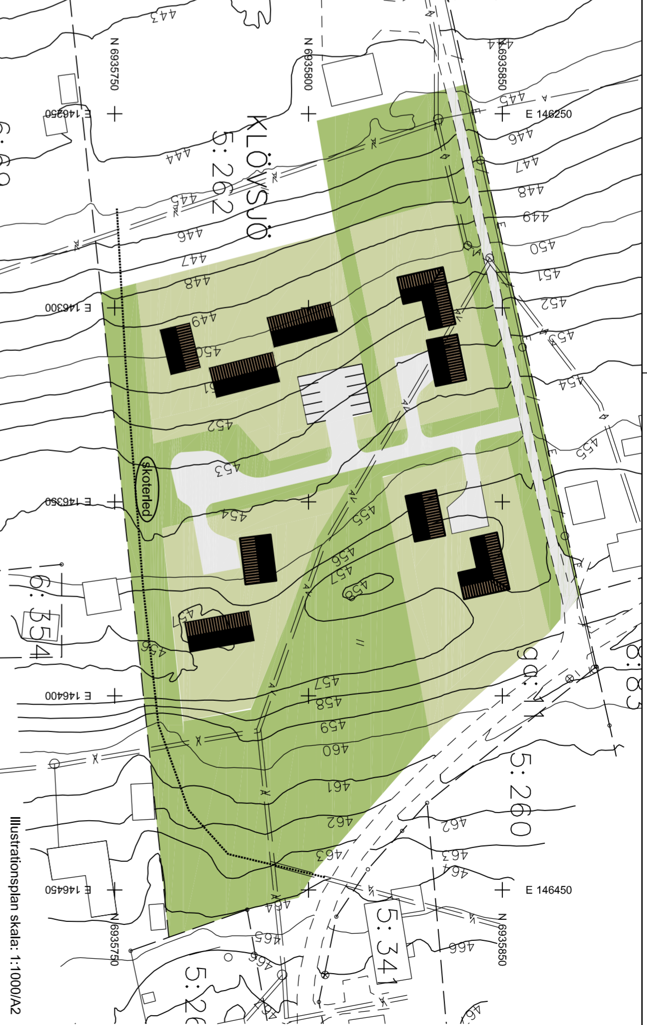
Illustrationsplan skala: 1:1000/A2