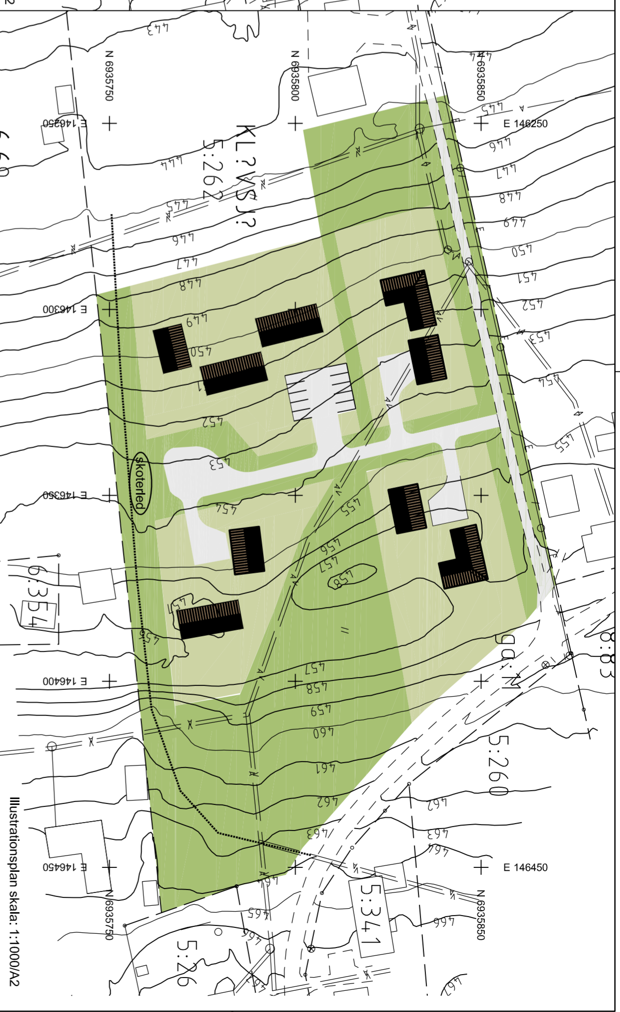
Grundkarta över Klövsjö 5:262 m. fl. i Bergs kommun, Jämtlands län. Upprättad 2015-01-08 av ArcTan AB i Östersund Uppdragsnr.: 141070

u Underjordiska ledningar - Område eller utrymme som ska vara tillgänglig för allmännyttiga underjordiska ledningar (PBL 4 kap 6 §)